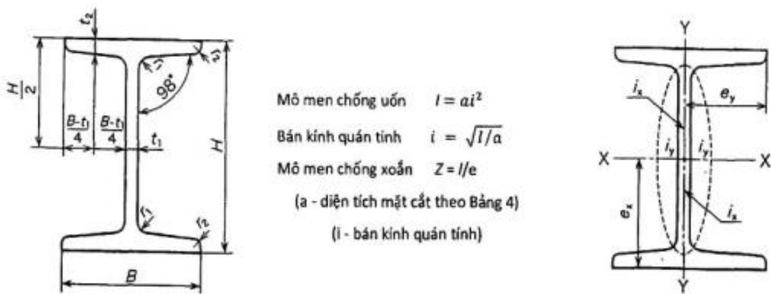
Hình 1 - Hình dạng mặt cắt ngang thép hình chữ I